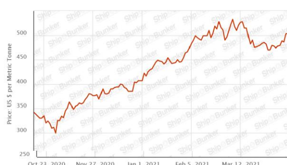
Cotação da tonelada do bunker "ifo 380" em Santos, em USD, sem impostos

O valor do VLSFO teve um aumento de mais de 34% em relação ao período anterior e a média do valor do dólar ficou em R$ 5,53 no mesmo período.