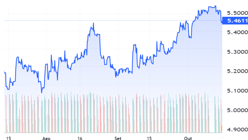
Dólar PTAX, fonte BACEN

Na média do trimestre, o preço do VLSFO subiu de R$2695 por tonelada para R$2889, representando aumento de 7,2% na despesa de combustível.